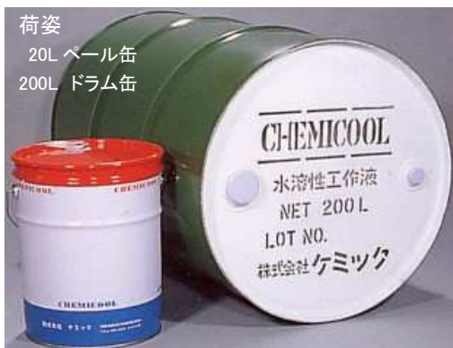
荷姿 20L ベール缶 200L ドラム缶

切削油剤の詳しい取り扱い方法は「金属加工油剤使用ハンドブック」を参照してください。